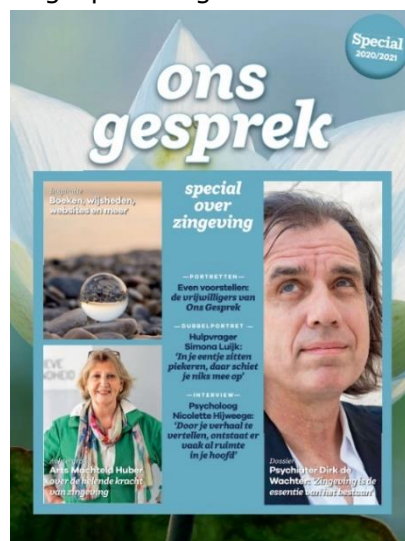
Mis 'm niet, onze special zingeving

In ledenmagazine Ons van december zit een bijzondere special over zingeving. December is bij uitstek de maand om terug te blikken (zeker dit jaar) en vooral ook om vooruit te kijken. Zingeving staat dan ook volop in de aandacht: aandacht voor zingeving blijkt namelijk bij te dragen aan gezond ouder worden en aan welbevinden. Zingeving gaat allang niet meer (alleen) over geloof of over de laatste levensfase. En doordat we met zijn allen langer thuis wonen, is er ook meer behoefte aan zingeving in de thuissituatie. Daarom heeft KBO-Brabant vrijwilligers opgeleid die met senioren (thuis) in gesprek gaan over levensvragen. Want een goed gesprek kan veel teweeg brengen. Hoe dit allemaal precies zit, leest u in de bewaarbijlage die u deze maand bij ledenmagazine Ons aantreft. Lees 'm aandachtig door en bewaar 'm goed, want onze vrijwilligers staan voor u klaar om met u in gesprek te gaan!